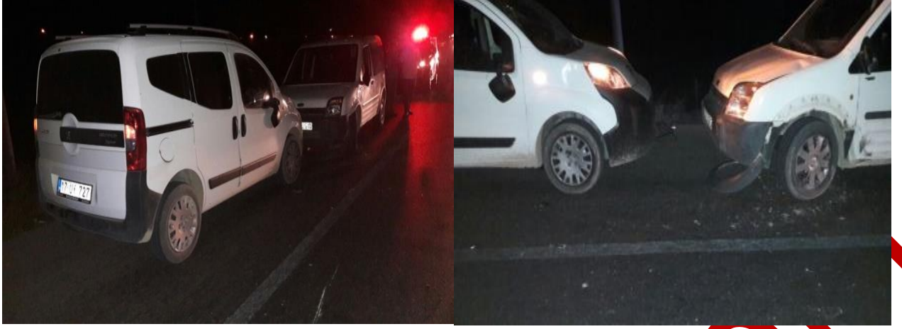
Resim-3 Olay sırasında Jandarma görevlileri tarafından çekilen resimler (Her iki araçta emniyet şeridi içerisinde)