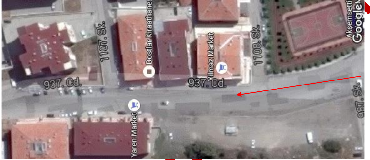
937. Cadde (Kaza yeri) uydü görüntüsü,