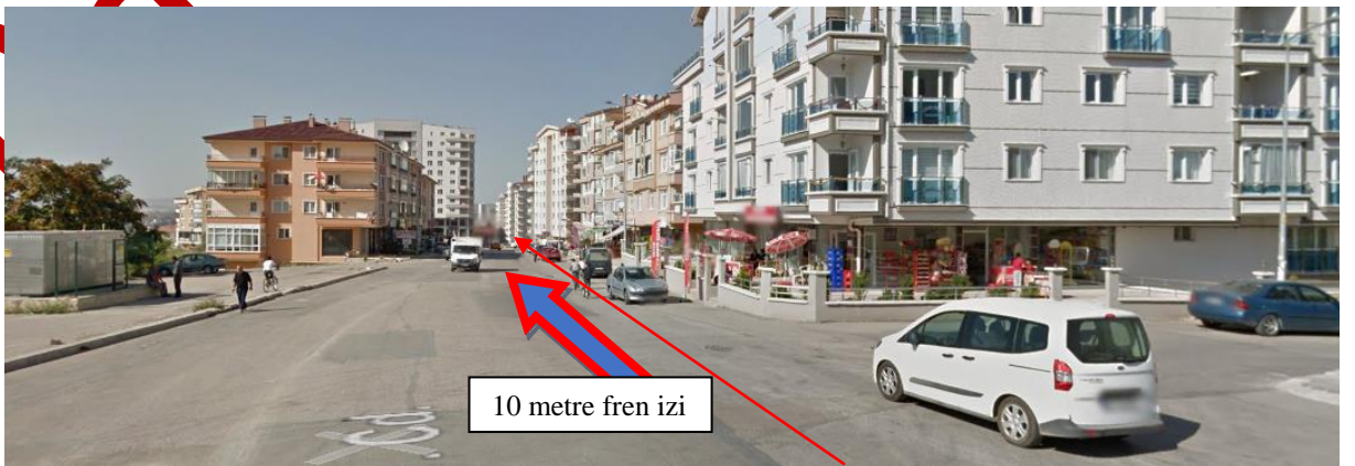
937. Cadde (Kaza yeri) Kaza yerinin uydü görüntüsünde işaretlenmesi.